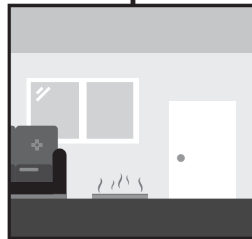
PAPILDOMAM PATALPOS ŠILDYMIUI